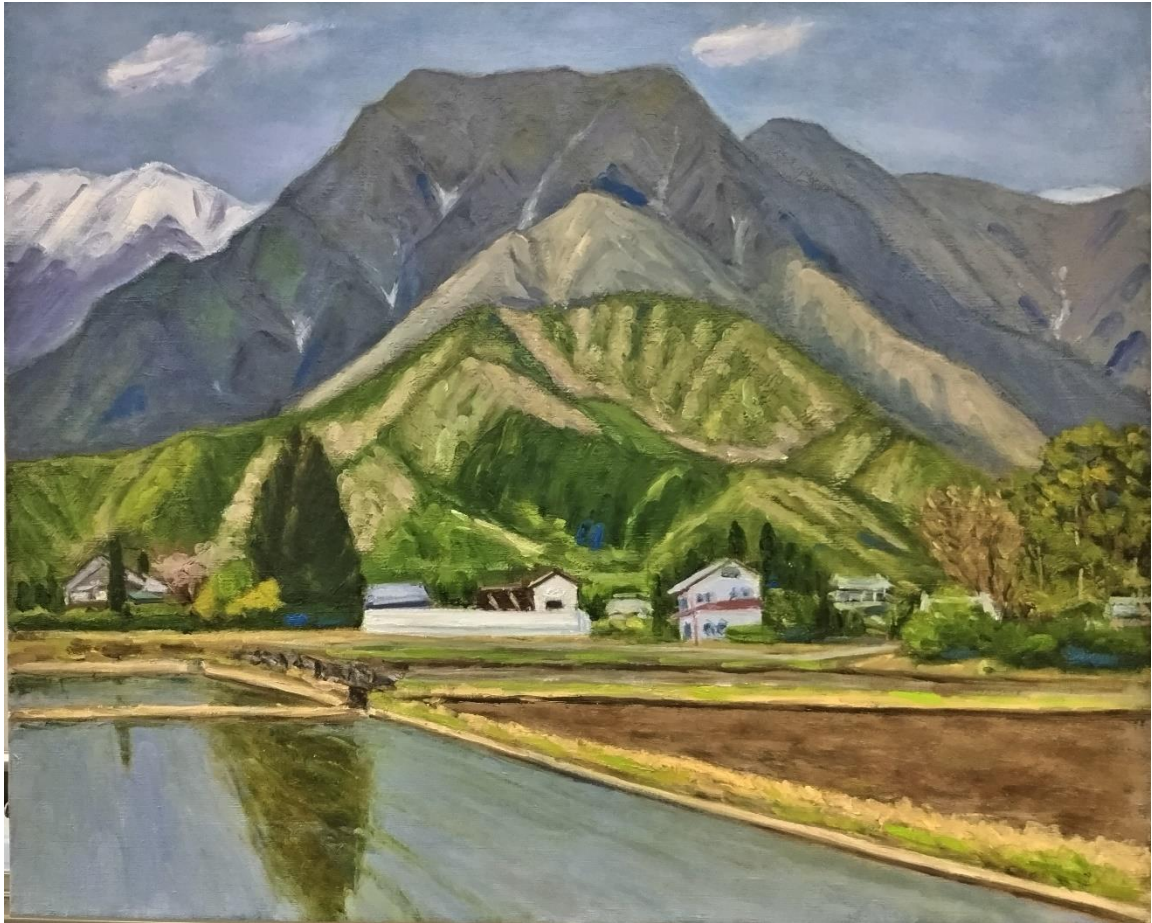
粕谷栄治「安曇野風景」F20（油彩）