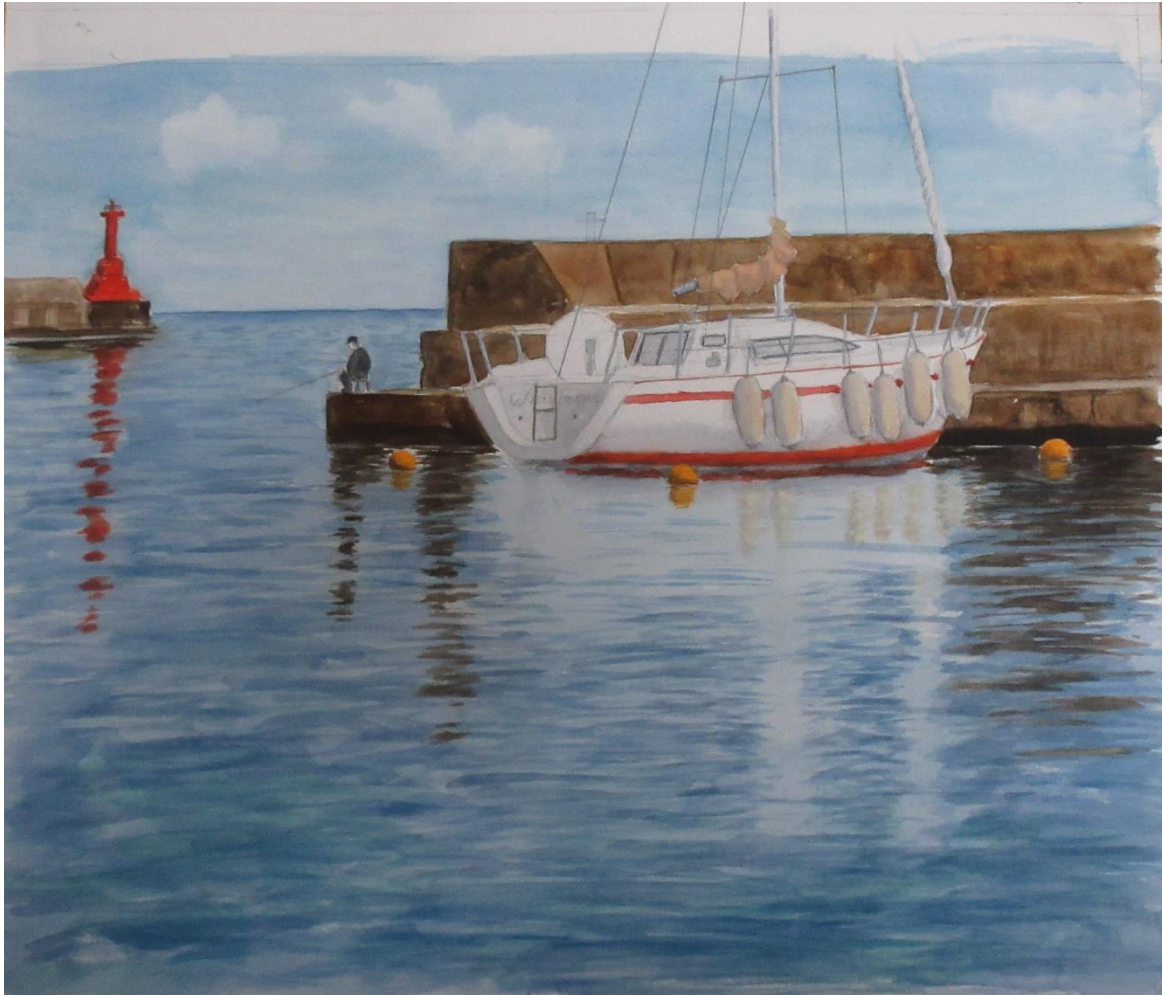
福室 正「真鶴港」P10（水彩）