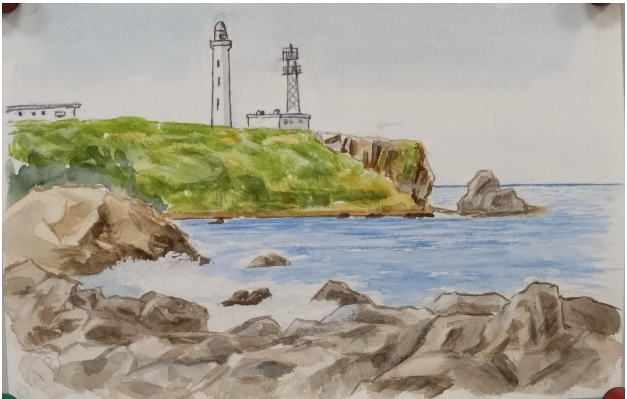
福室 正「犬吠埼灯台」F3（水彩）