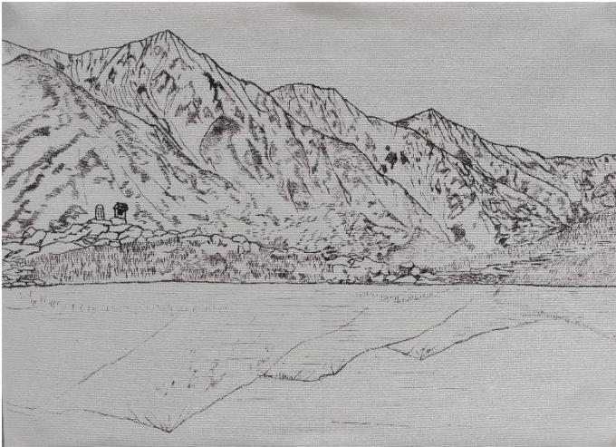
坂本 隆 「白馬連峰と八方池」A3 (鉛筆)