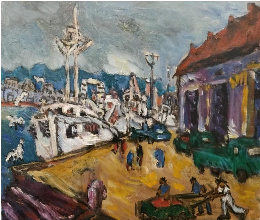
喜田祐三「小樽漁港」F10（油彩）