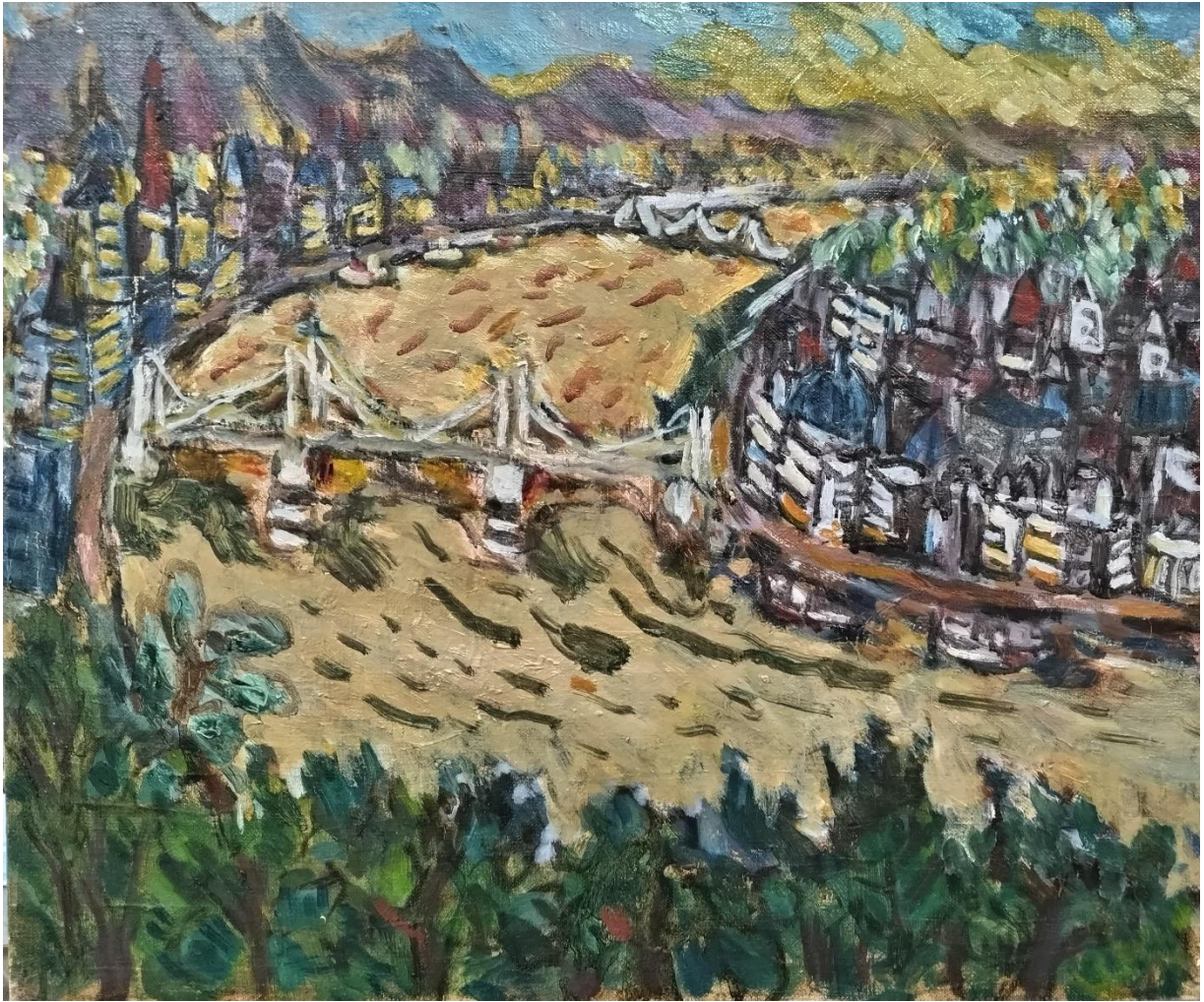
喜田祐三「ブダペスト鳥瞰図」F10（油彩）