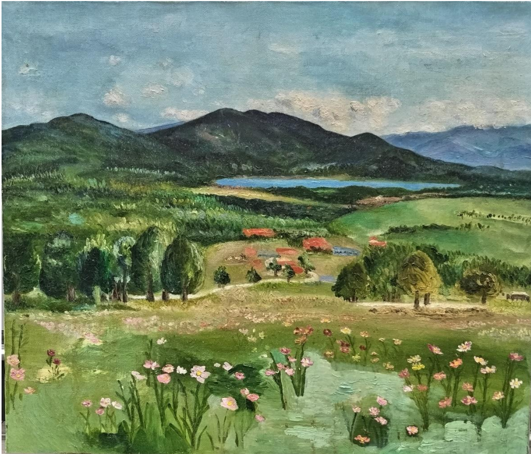
島川修子「秋の黒姫公園・長野」F10（油彩）