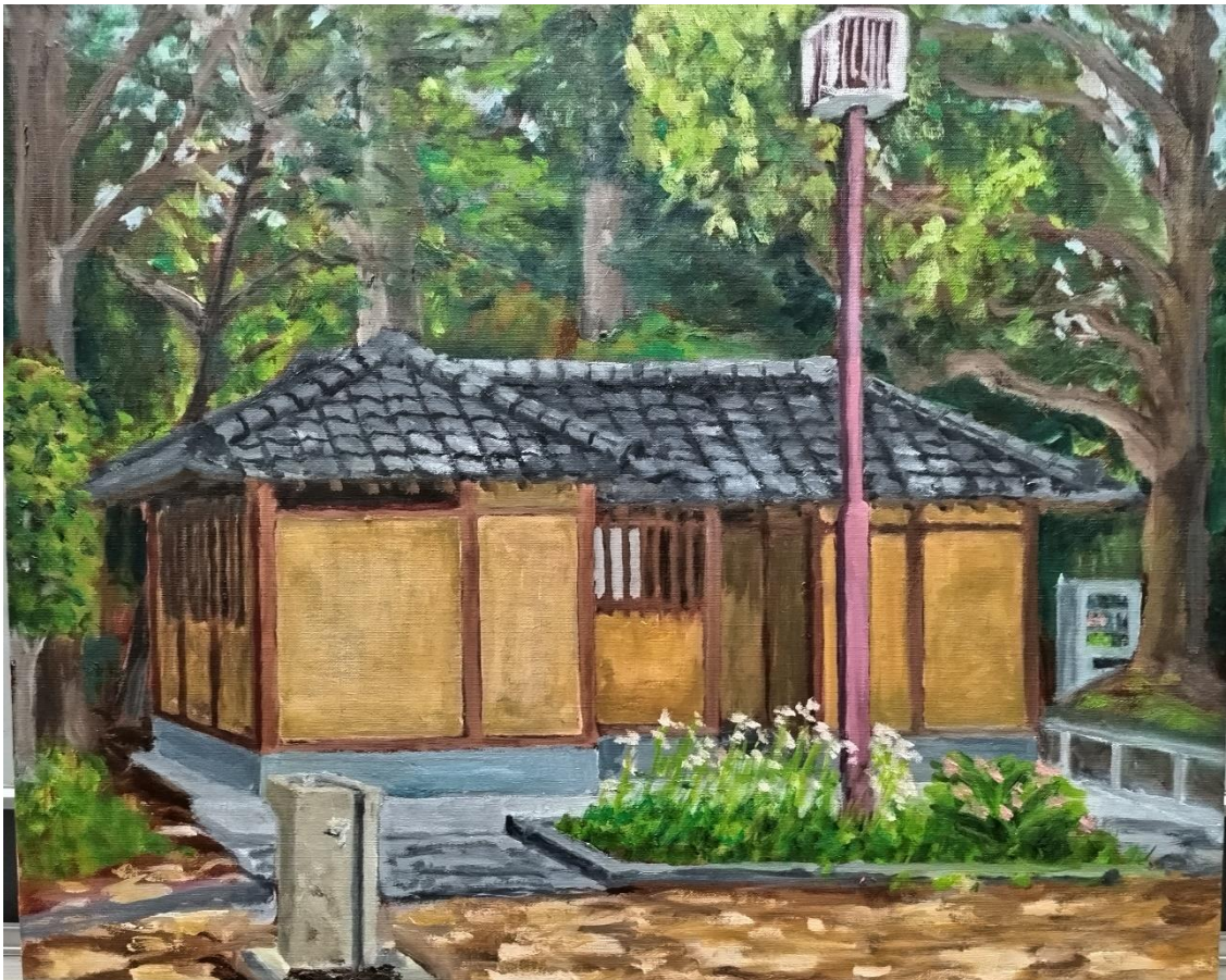
仲 弘「20枚の風景デッサンから1枚を油彩画に（課題）」F15（油彩）