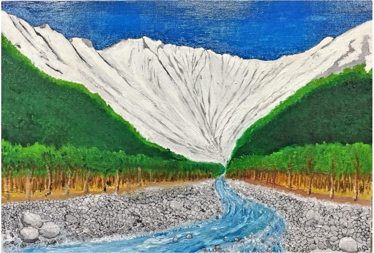
坂本 隆「梓川と残雪の奥穂高岳・穂高連峰」P6（油）