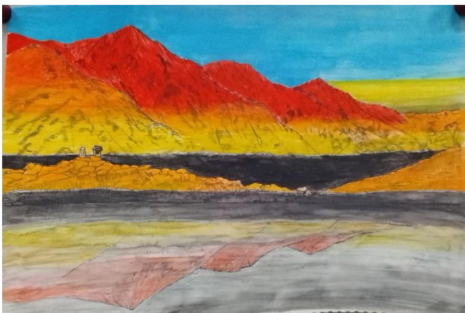
坂本 隆「朝焼けの白馬連峰と八方池」A3 (水彩)