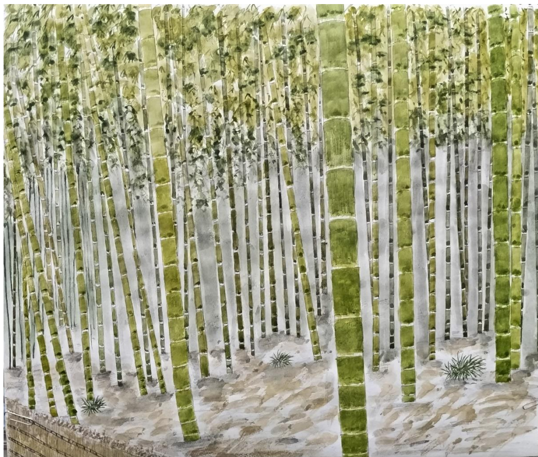
植田千秋「竹林」(構図1) F10 (水彩)