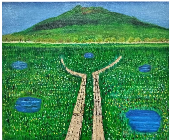
坂本 隆「残雪の至仏山と尾瀬ヶ原・初夏」F8（油彩） 坂本 隆「燧ヶ岳と尾瀬の垂高山植物・盛夏」F8（油彩）