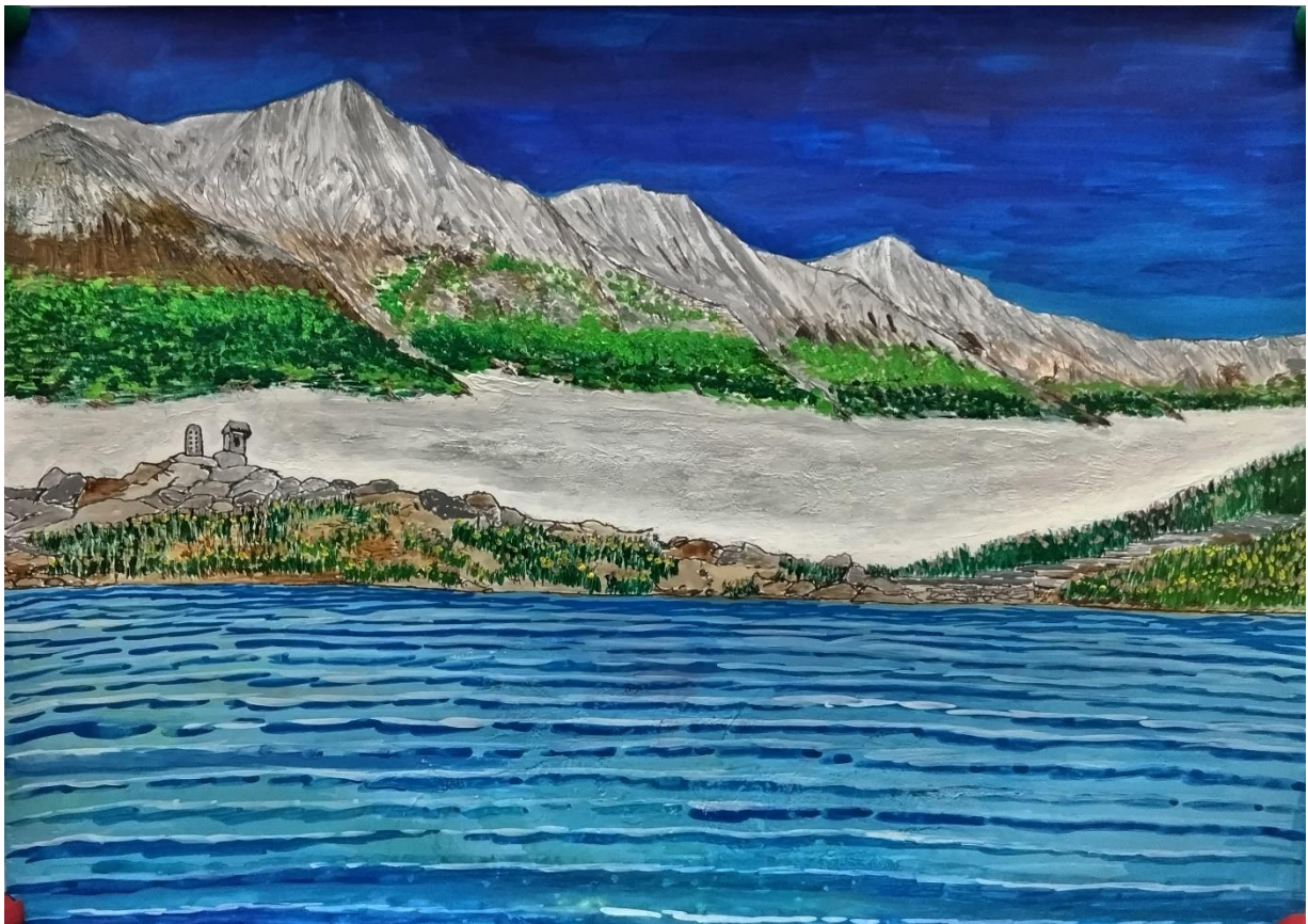
様本 隆「夏季の白馬連峰と八方池」A3 (水彩) (手直し版)