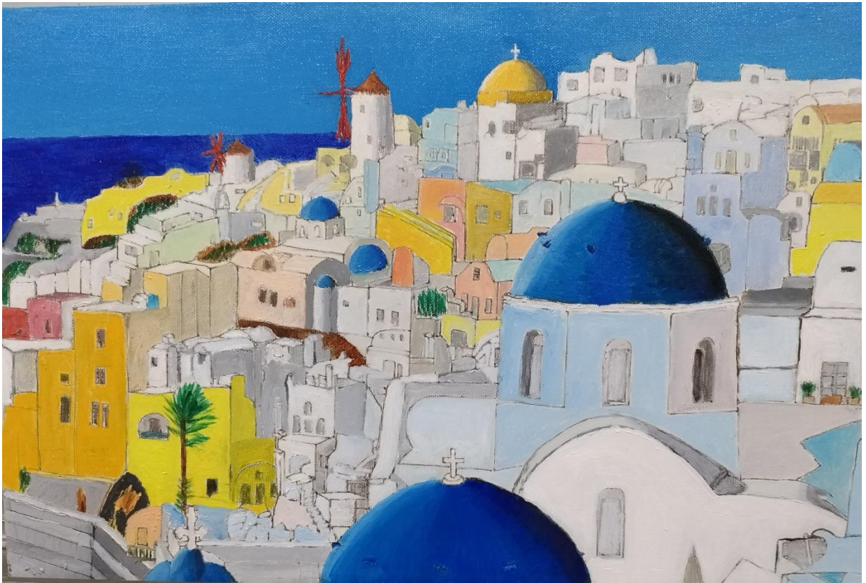
坂本 隆「ギリシャ サントリーニ島」P6（油彩）（見直し版）