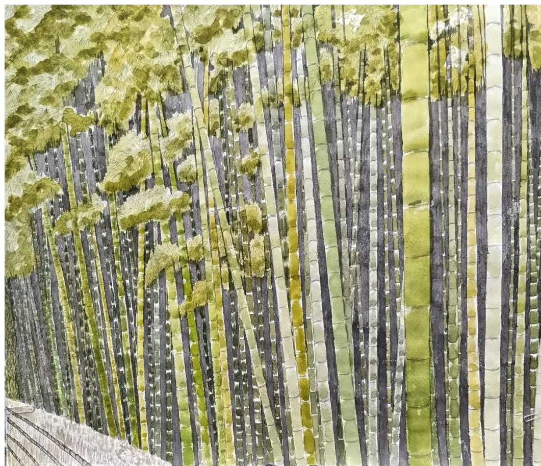
植田千秋「竹林」(構図2) F10 (水彩)