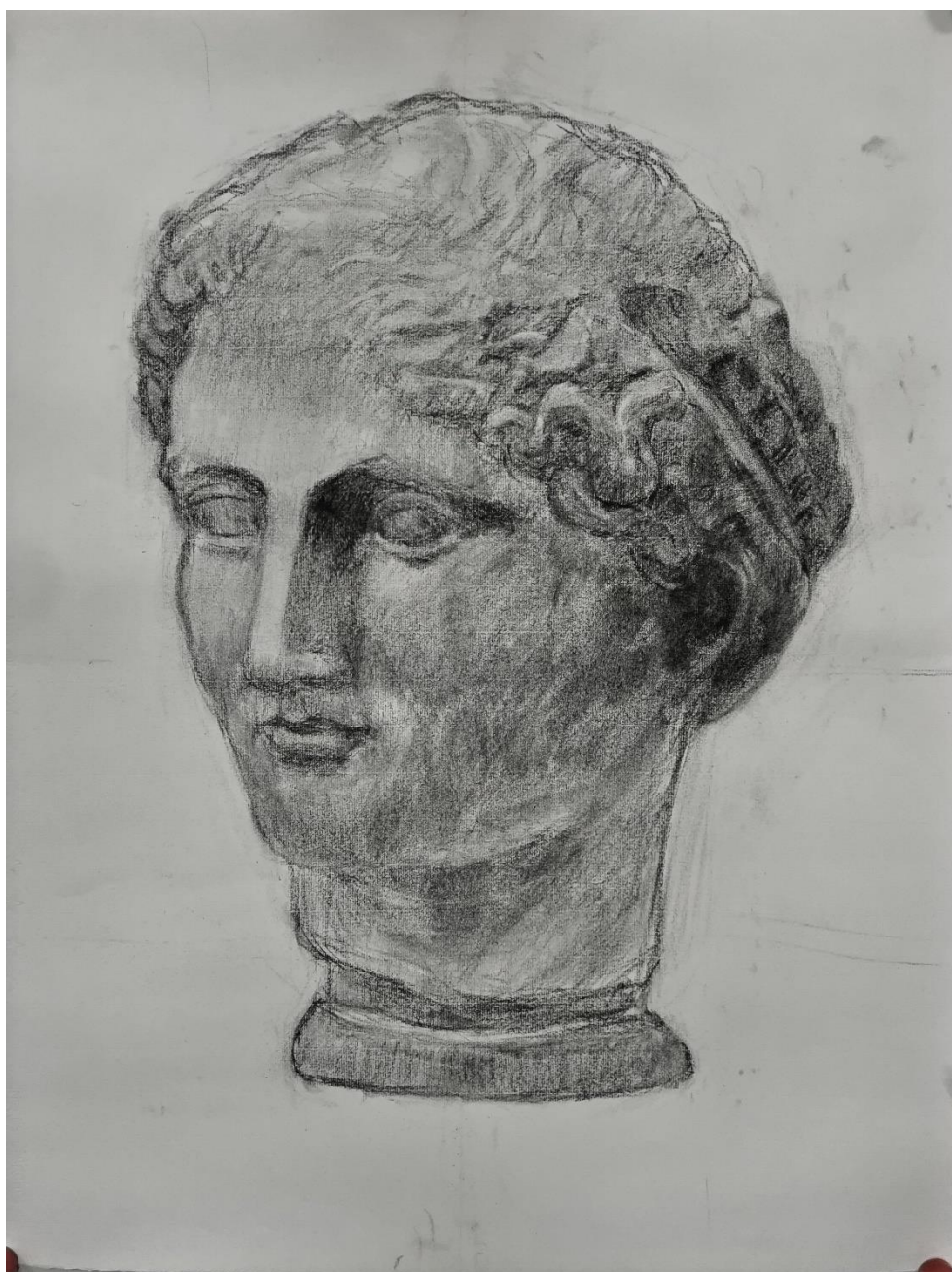
福室 正「石膏デッサン」木炭紙（木炭）