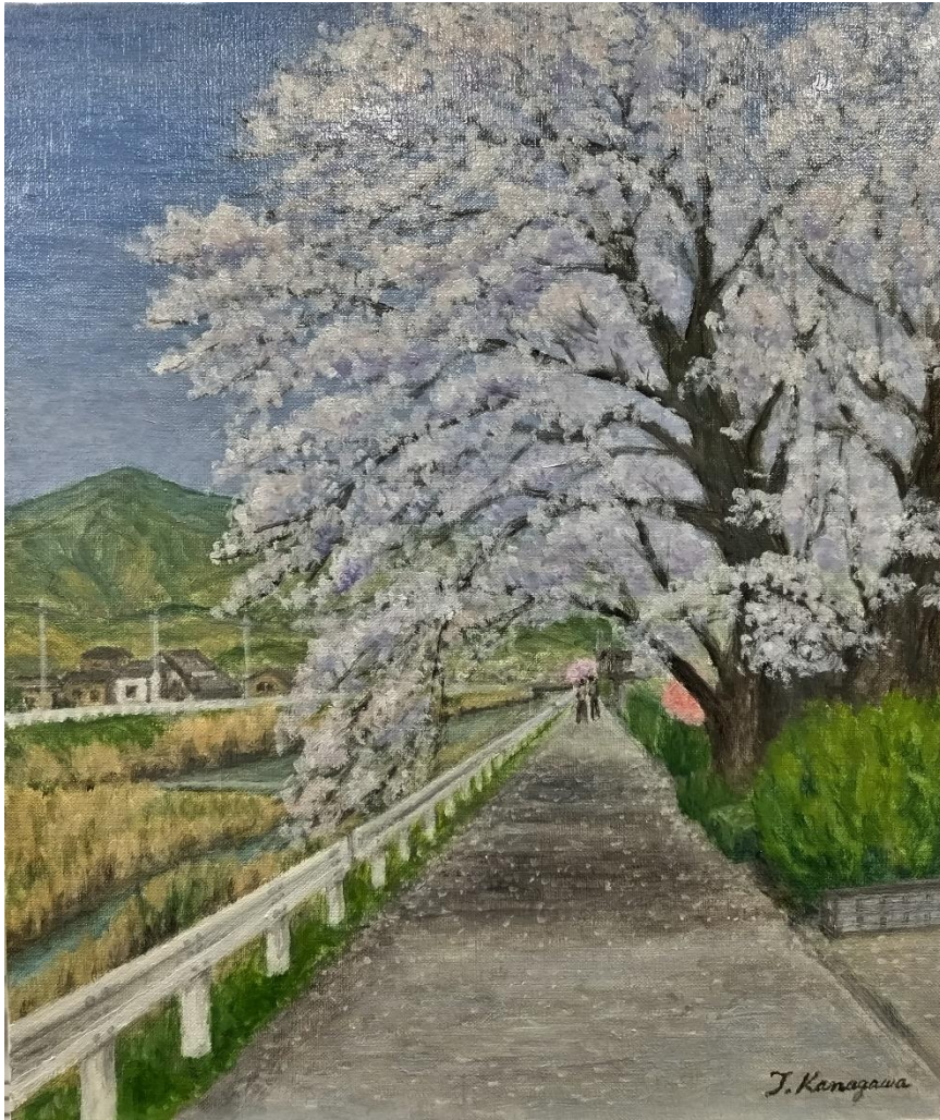
金川敏夫 「厚木の桜」 F8（油彩）