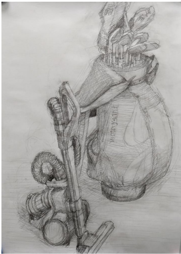
仲 弘「ゴルフバッグと掃除機」B3 (鉛筆)