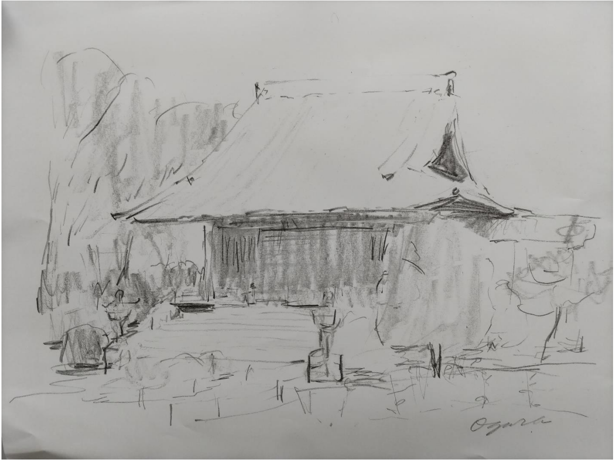
小倉裕之「グラファイトで寺を素描1」A3（グラファイト）