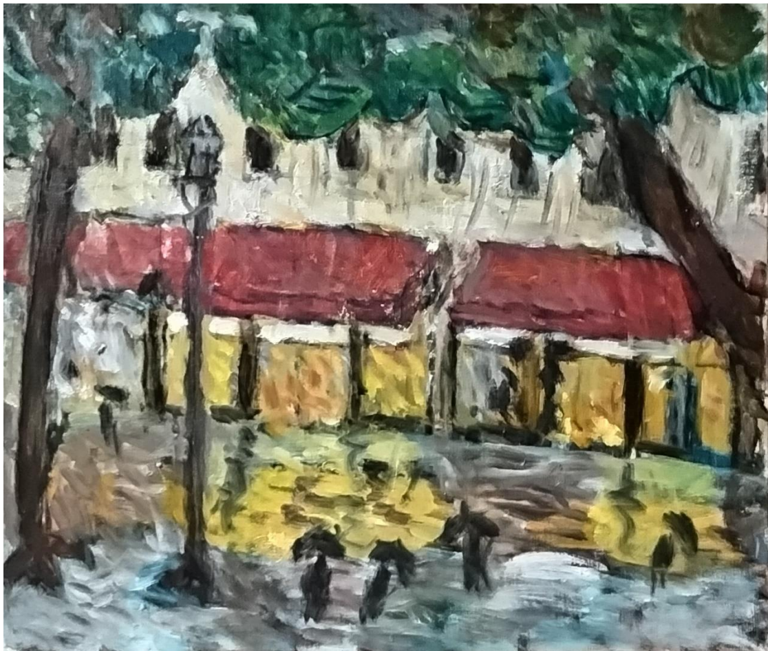
喜田祐三「雨のルシーニュ通り」F10（油彩）