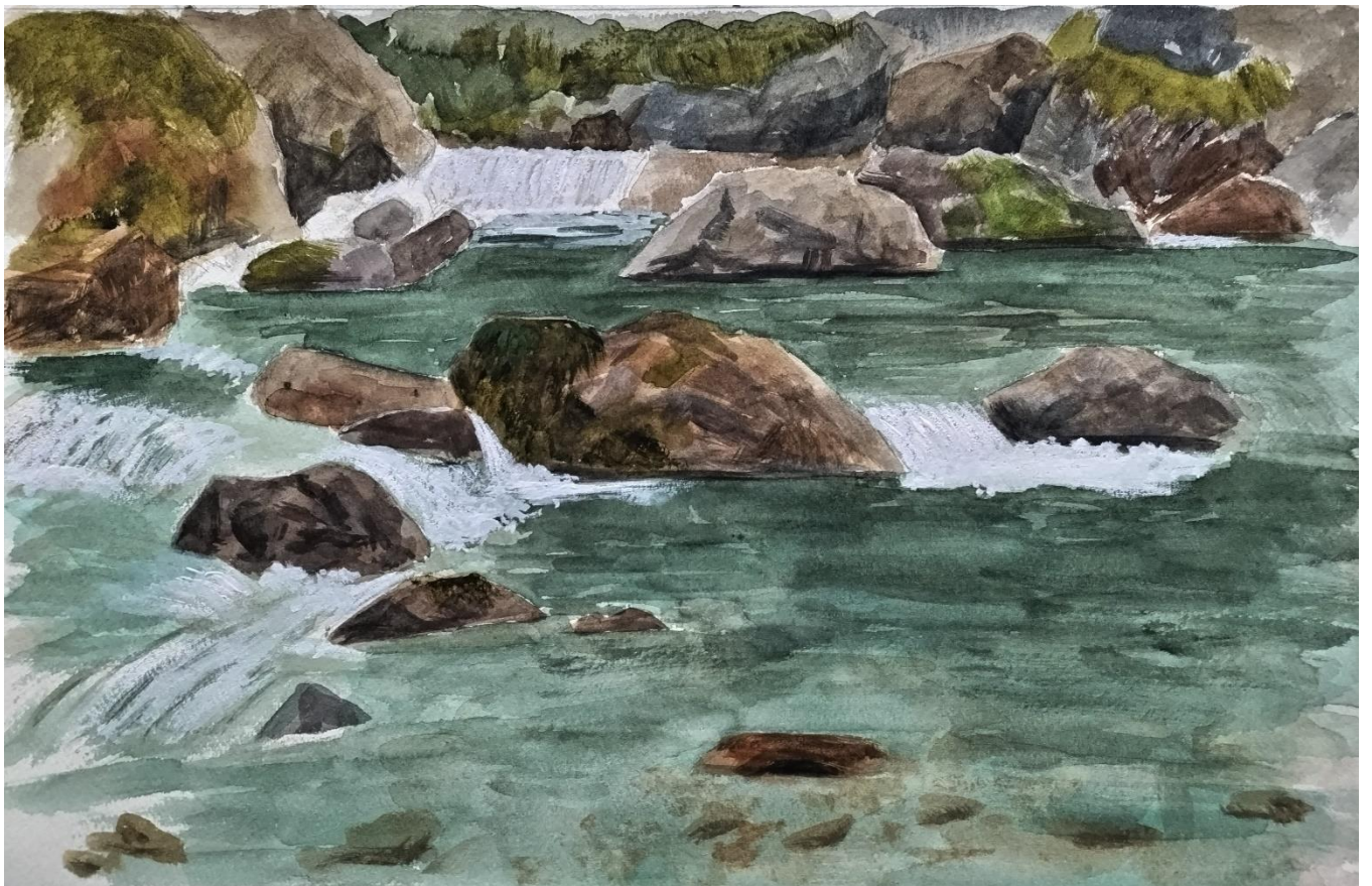
福室 正「八ヶ岳の溪流」P6（水彩）