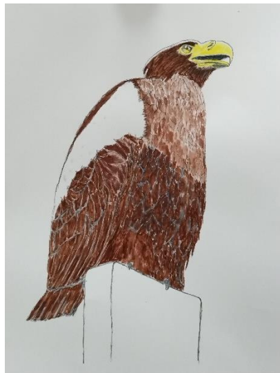
坂本 隆「大鷲」A3 (水彩)