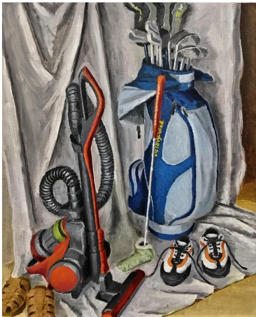
仲 弘 「ゴルフバッグと掃除機」 F15 (油彩)