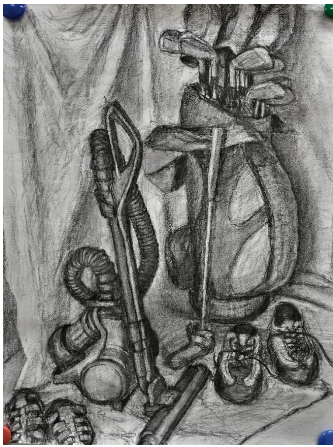
仲 弘「ゴルフバッグと掃除機」木炭紙 (木炭)