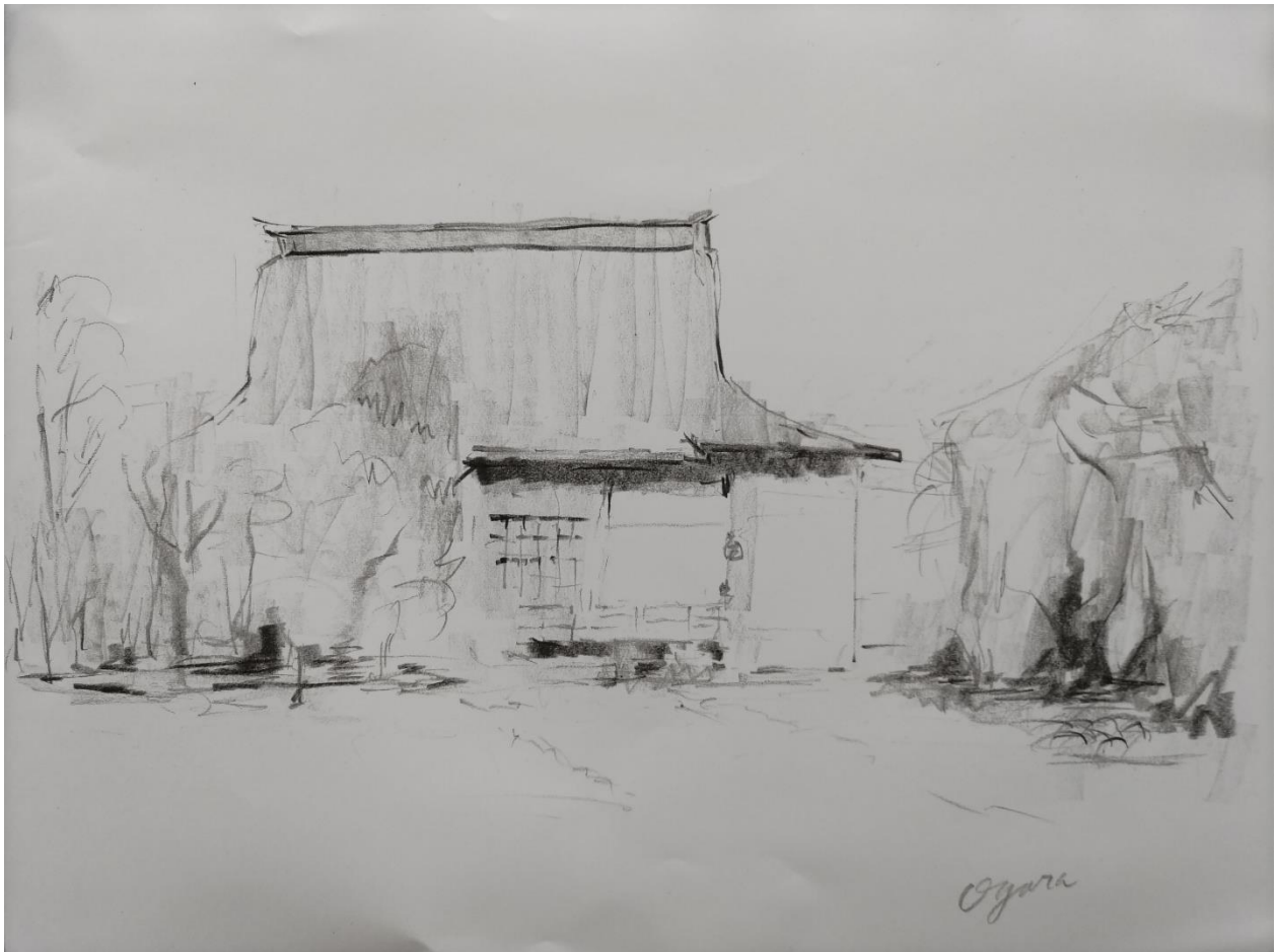
小倉裕之「グラファイトで寺を素描2」A3（グラファイト）