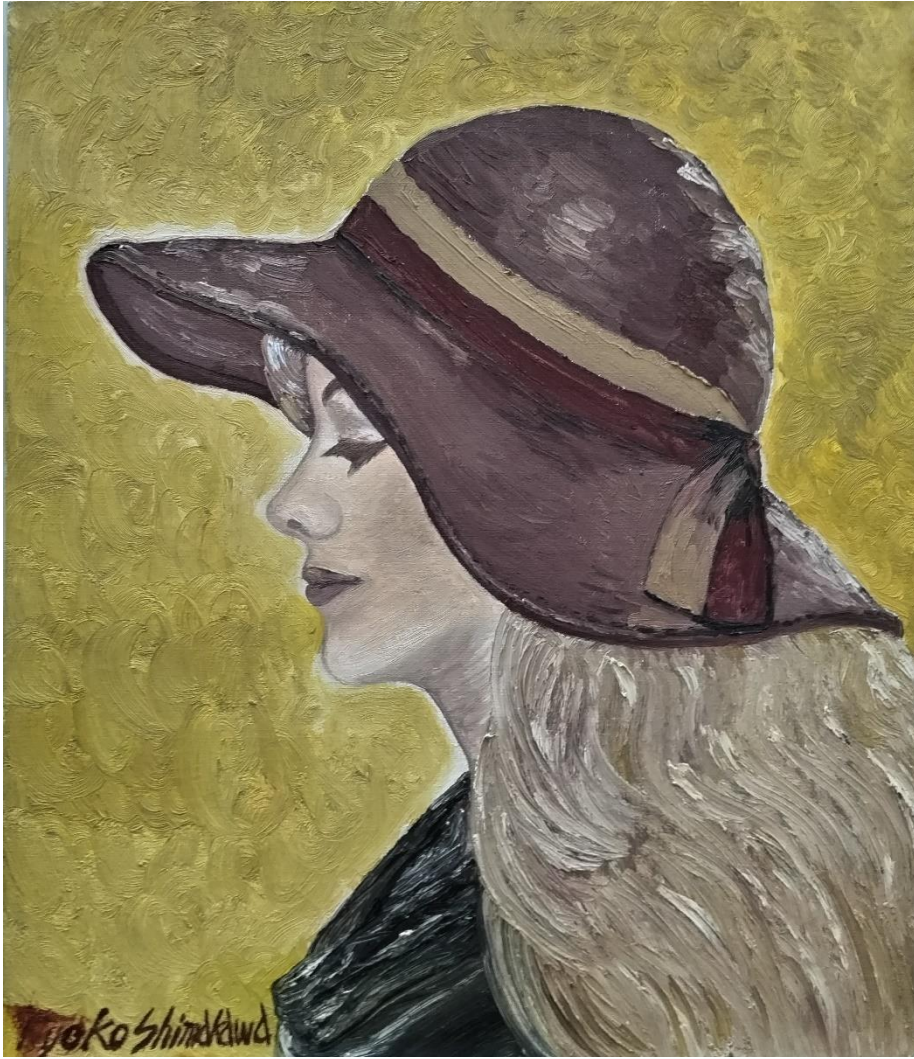
島川恭子 「自画像」 F10（油彩）