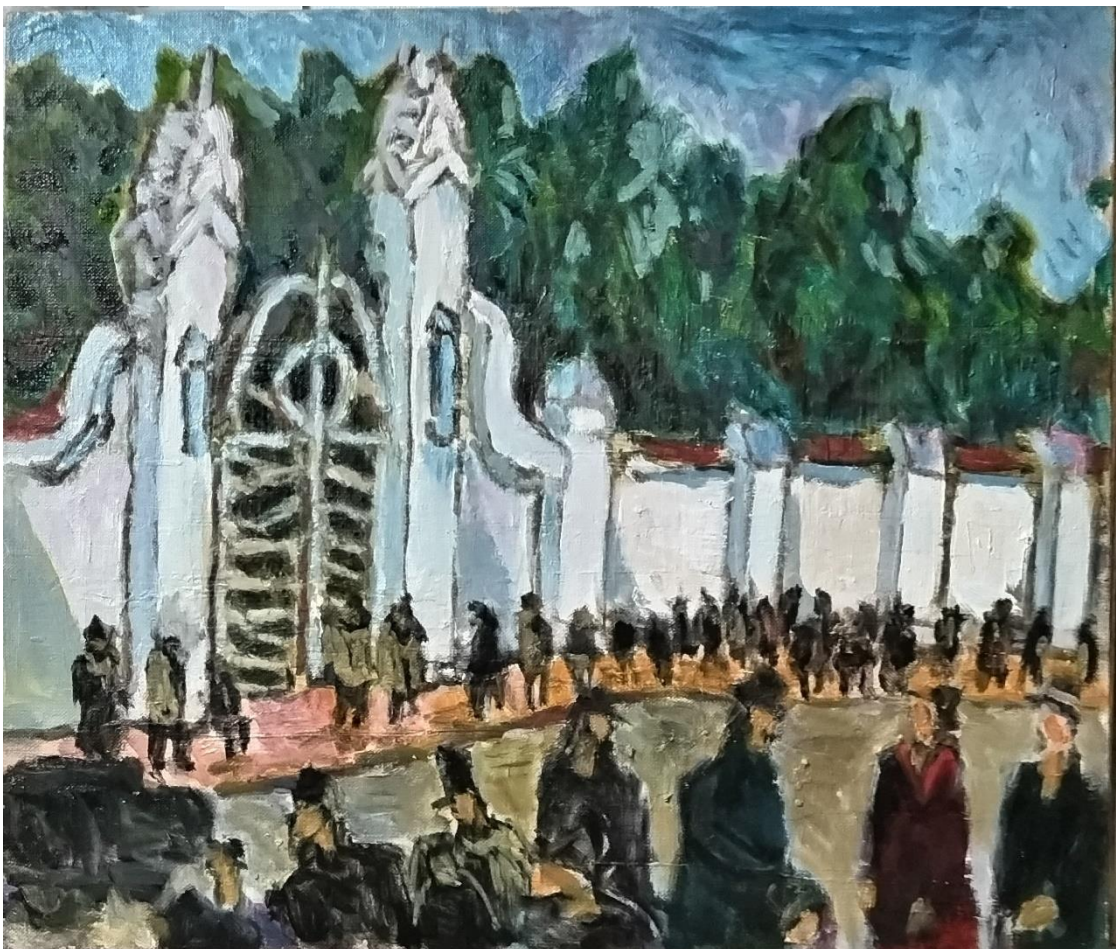
喜田祐三「カフカ忌の葬列」F10（油彩）