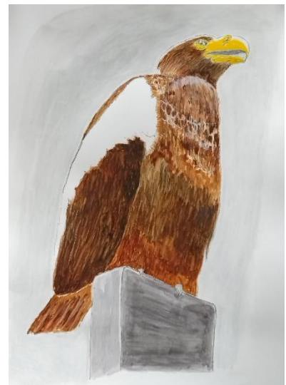
坂本 隆「大鷲」A3 (水彩)