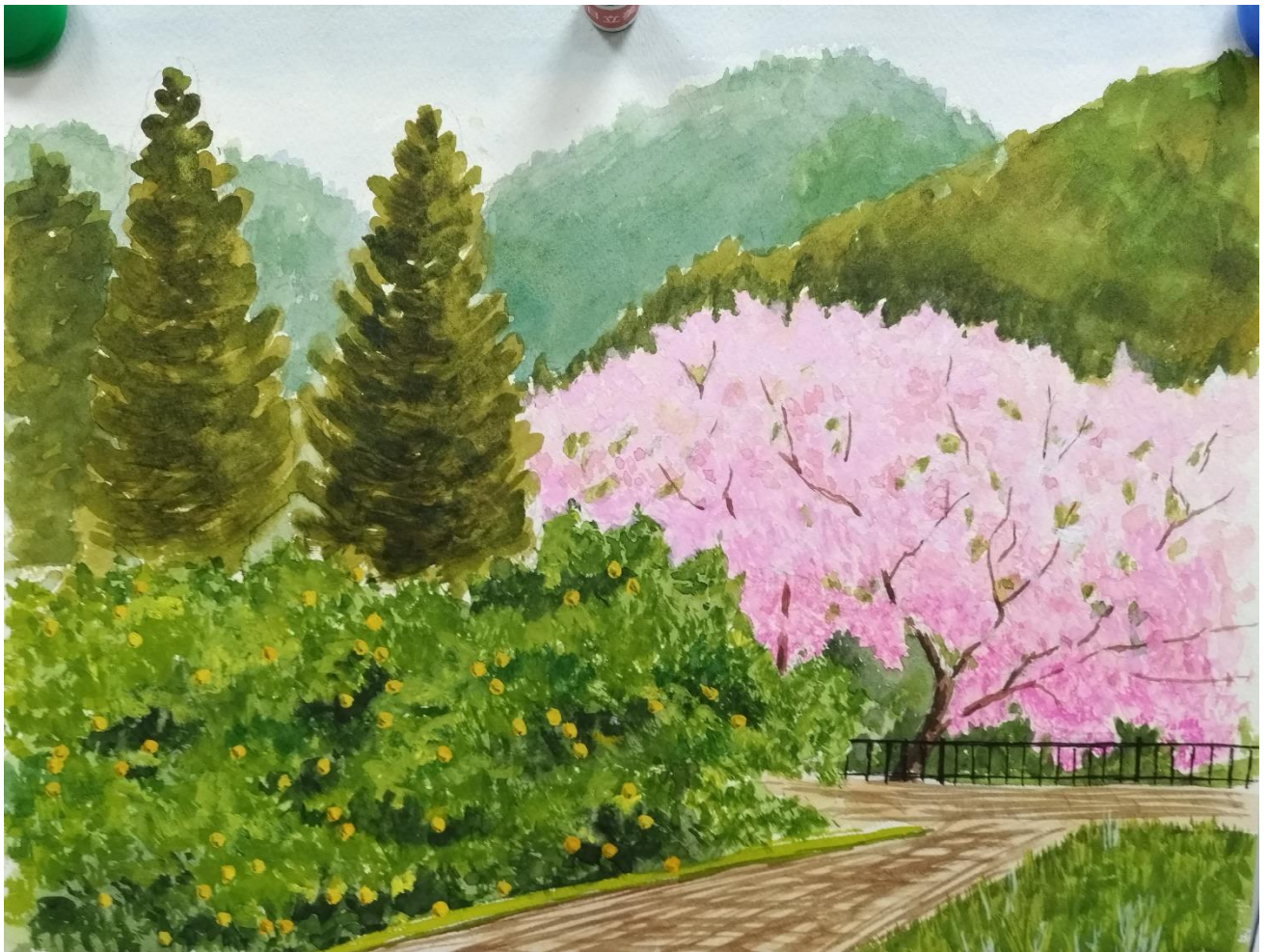
福室 正「河津桜と夏ミカン」F6（水彩）