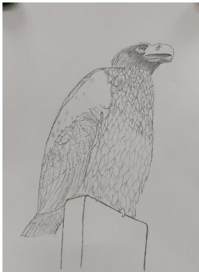
坂本 隆「大鷲」A3 (鉛筆)